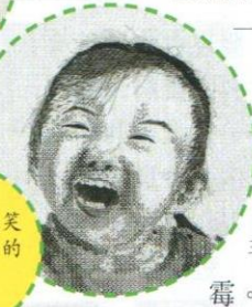
以小女兒笑臉為題材的黑繡