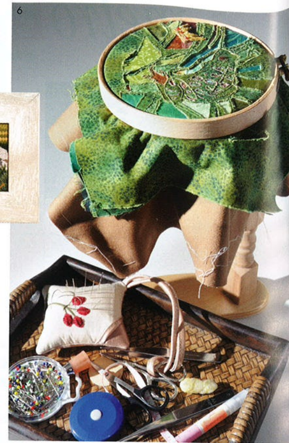
1. Mimi去年在灣仔開設了自己的刺繡工作室「遊走刺繡」，身後展示出各種顏色的繡花線。 2. 這幅製作中的刺繡是Mimi為「香港青年刺繡師計劃」而設計的初稿。 3. 凱特王妃去年大婚之日穿上的婚紗，Mimi有份參與製作。 4. 這幅立體的《捕魚蜘蛛俠》無論是製作技巧及創意也爆燈。 5. (左起) 立體作品《看書的女孩》、Mimi小女兒人像作品《Livia》利用黑繡的技巧製作，作品《羊》加入了茄士咩物料。 6. 刺繡時所需的各種工具。 7. 簡單的一條繡花線可變化出無限的可能性。 8. 英國皇家刺繡學院老師Shelly Cox，是Mimi最喜愛的老師。

Mimi坦言十分滿意轉型後的生活，尋求到自己的理想，可用自己的興趣去教人，做喜歡的刺繡。為了鼓勵年輕人勇敢追求自己的理想，她發起了「香港青年刺繡師計劃」，不收費的教導一群有創作天份的年輕人刺繡，合力製作一幅一米乘兩米的刺繡作品作慈善用途，一舉多得。■