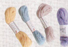
Tour Embroidery 毛綫 $10-$16