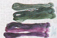
House of Embroidery 棉綫(混色) $30