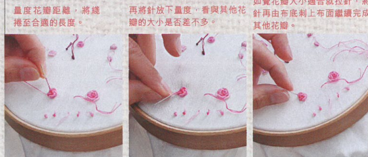
量度花瓣距離，將綫捲至合適的長度。