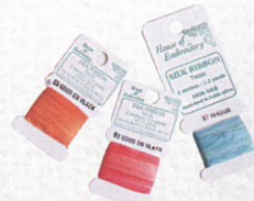
House of Embroidery 刺繡絲帶 $39-$54

西方刺繡使用的綫以棉綫、金屬綫、毛冷綫及絲帶為主，另外刺繡針也十分講究，例如 Embroidery 刺繡針，比一般縫衫針的針眼長，以保持綫的完整；又有絲帶專用的 Chenille 雪尼爾針、十字繡專用的 Tapestry 繡帷針及在布後執綫用的 Curved quilting needles 彎針等用來配合不同刺繡技巧。